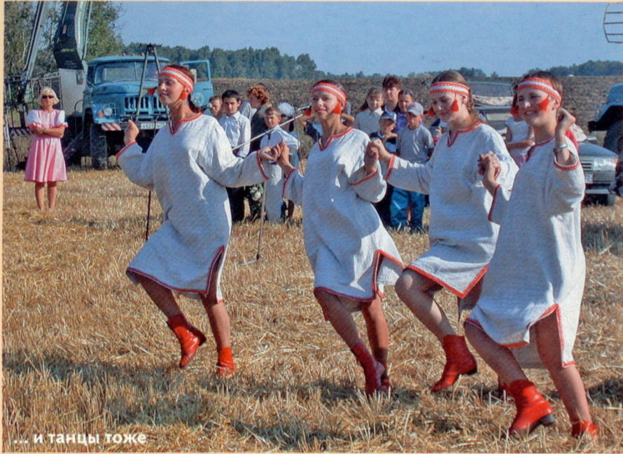
... и танцы тоже

федеральном уровне наши лыжники лучше, чем челябинские, что уж там.