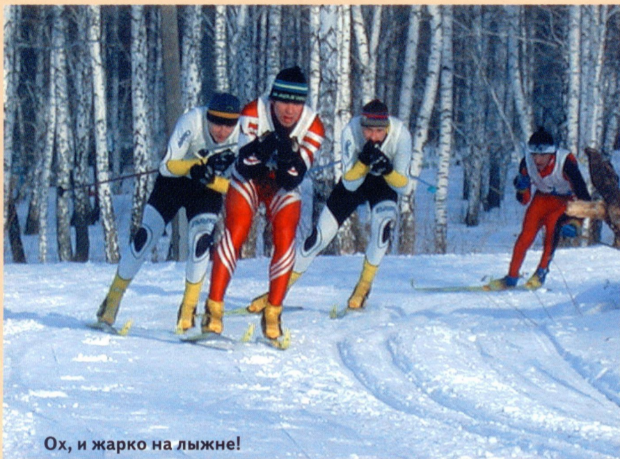
Ох, и жарко на лыжне!

бернатора и Управления автодорог, направленные на благоустройство Тюмени, заслуживают одобрения. Возьмем, к примеру, московское начальство. Приезжают — восторг! И отношение сразу меняется в лучшую сторону. И к Тюмени, и к области. А раз столичные гости видят, что деньги здесь не закапывают в землю, а действительно направляют на развитие, во благо людям, то и федеральные программы, думаю, предпочтут размещать там, где с ними умеют работать. Ну а сделают центр — придут к нам. Это процесс закономерный. Тут меня некоторые экспрессивно настроенные граждане уже сравнили с великим реформатором Петром I. Перегнули, конечно, палку, а вот применительно к губернатору и его деятельности это сравнение звучит вполне оправданно.