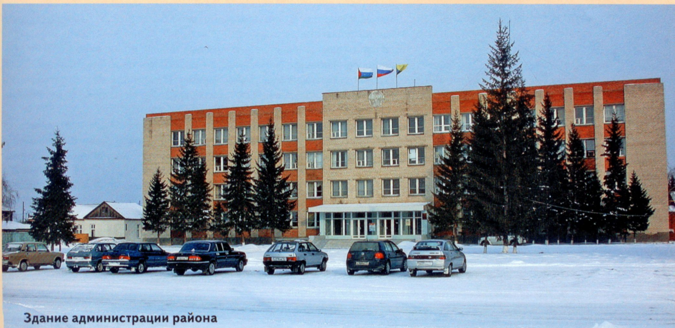
Здание администрации района

запросто сядет за руль трактора и комбайна. Он с гордостью говорит: «Я человек деревенский».