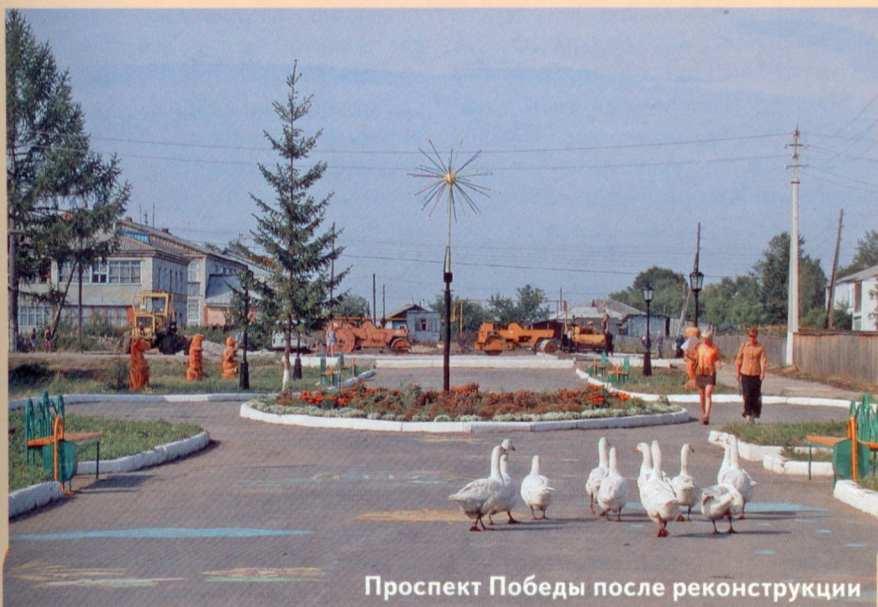
Проспект Победы после реконструкции

- стараемся заранее завезти на при- трассовые склады каменные материа- лы. По плану 2004 года их потребует- ся 16 тысяч тонн. 9 тысяч тонн щебня уже отгрузили.