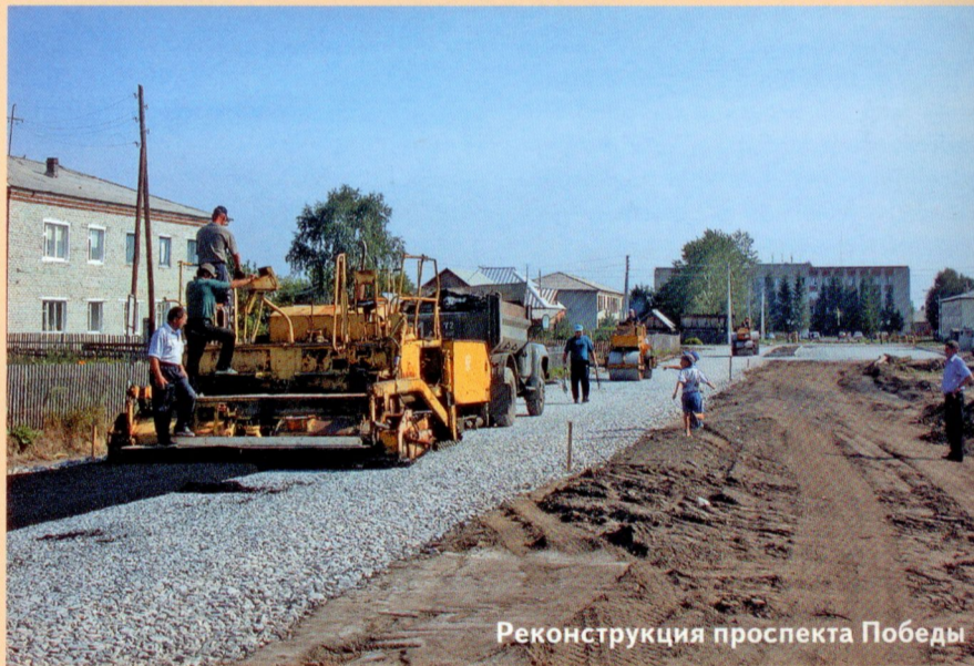
Реконструкция проспекта Победы

-Сегодня мы — единственный дорожный подрядчик в районе. ДСУ-3 расформировано, другие строительные организации тоже ушли. Кстати, «хлебная» так и не достроена — вплотную к Армизонской границе твердое покрытие не подведено. С одной стороны, нам это положение вещей на руку — все объемы достаются ДРСУ, пополняется технический парк. С другой — темпы строительства дорог снова упали. Тем не менее работы продолжают. Один из важных объектов — дорога к деревне Карагужево. Попасть