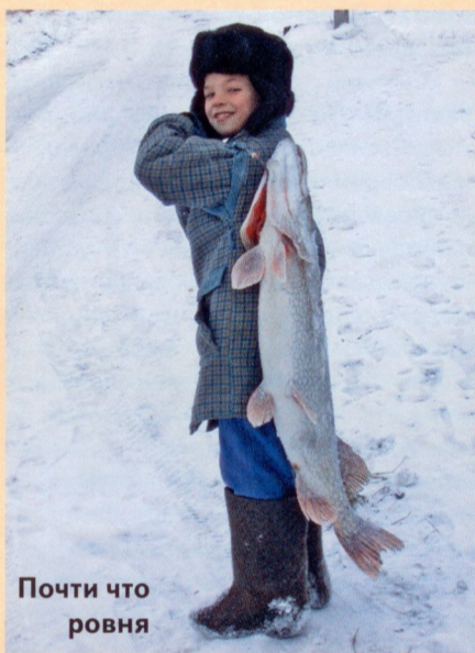
Почти что ровня

Если кратко охарактеризовать нынешнее состояние дорог в районе... Вроде бы населенные пункты доступны для транспорта. Но асфальт и щебень далеко не везде. В весеннюю распутицу попадать в некоторые де-