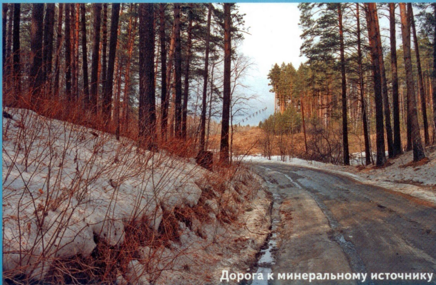
Дорога к минеральному источнику