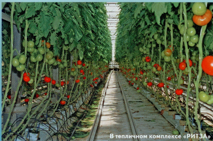
В тепличном комплексе «РИТЗА»

Собранный урожай проходит автоматическую сортировку, после че-